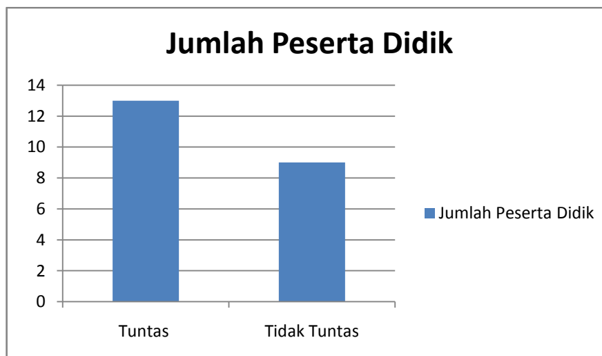
Diagram 2 Ketuntasan peserta didik pada siklus I