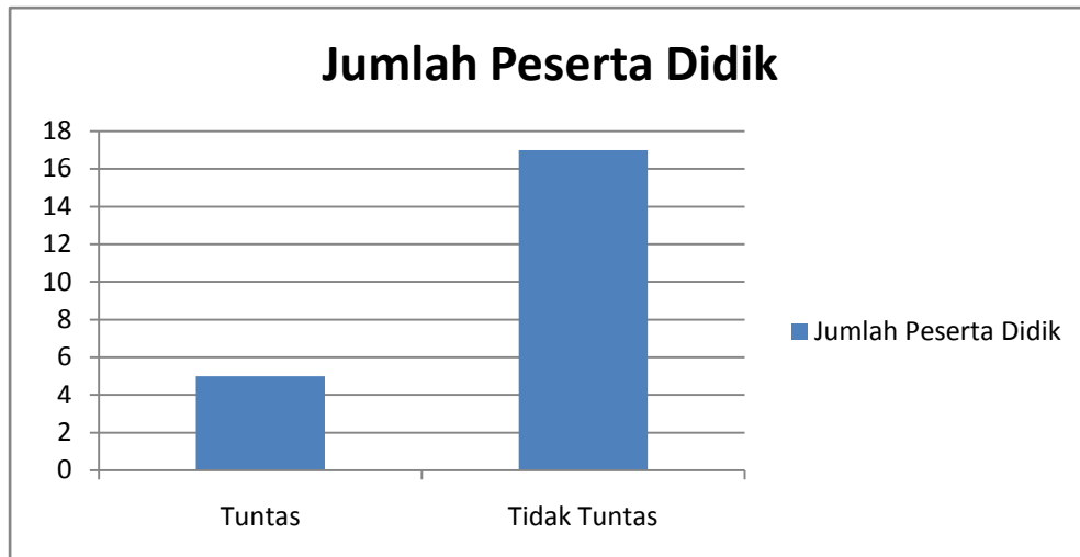
Diagram 1 Ketuntasan peserta didik pada pra siklus