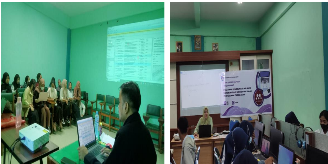
Gambar: Kegiatan Pemaparan materi, Diskusi, Tanya jawab dan praktek

Setelah pemaparan atau pengenalan aplikasi referensi Mendeley, selanjutnya ditampilkan informasi keunggulan aplikasi tersebut. Dimulai dengan diskusi mengapa Anda harus menggunakan Mendeley, lanjutkan ke diskusi tentang perbedaan Mendeley dari program manajer referensi lainnya. dan diakhiri dengan pembahasan tentang manfaat referensi Mendeley bagi pengorganisasian referensi dalam penulisan ilmiah.