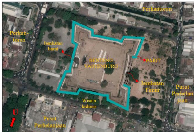
Gambar-3. Komplek Benteng Vastenburg Surakarta

Dengan adanya parit yang mengelilingi tembok benteng, maka akses masuk ke dalam benteng hanya bisa melalui 2 pintu gerbang yaitu pintu gerbang barat dan pintu gerbang timur. Di depan pintu gerbang ada jembatan untuk menyebrangi parit. Jembatan ini dulu aslinya berbentuk jungkit dan sewaktu-waktu bisa diangkat-turunkan, tapi sekarang sudah berubah menjadi jembatan permanen dari beton (Gambar 4).