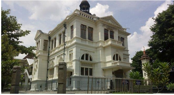
- Gedung Bank Indonesia