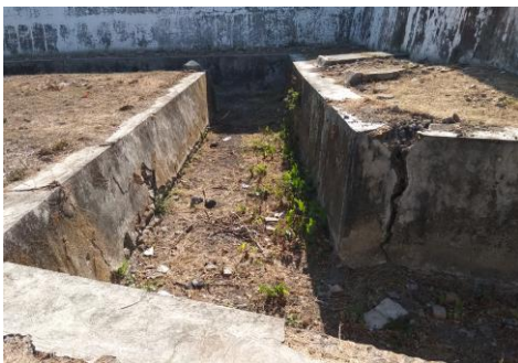
Gambar-5. Kondisi Parit Sekarang

Kondisi fisik bangun Parit Benteng Vastenburg saat ini secara keseluruhan sangat memprihatinkan. Talut-talutnya banyak yang pecah di beberapa titik, dasar parit ditumbuhi rerumputan dan semak, bahkan di beberapa ruas berubah fungsi menjadi tempat pembuangan sampah (Gambar-5).