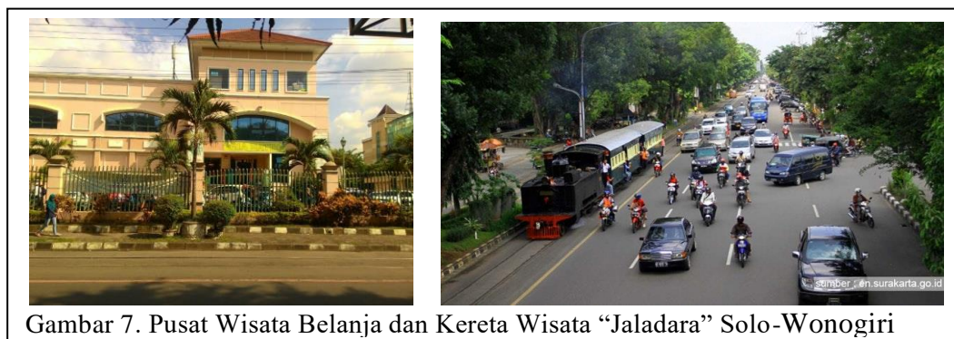
Gambar 7. Pusat Wisata Belanja dan Kereta Wisata “Jaladara” Solo-Wonogiri

Bentuk bangunan kolonial semakin memperkuat nuansa sejarah. Hal ini terlihat pada gedung Bank Indonesia (BI), Kantor Pos, dan Bank Danamon.