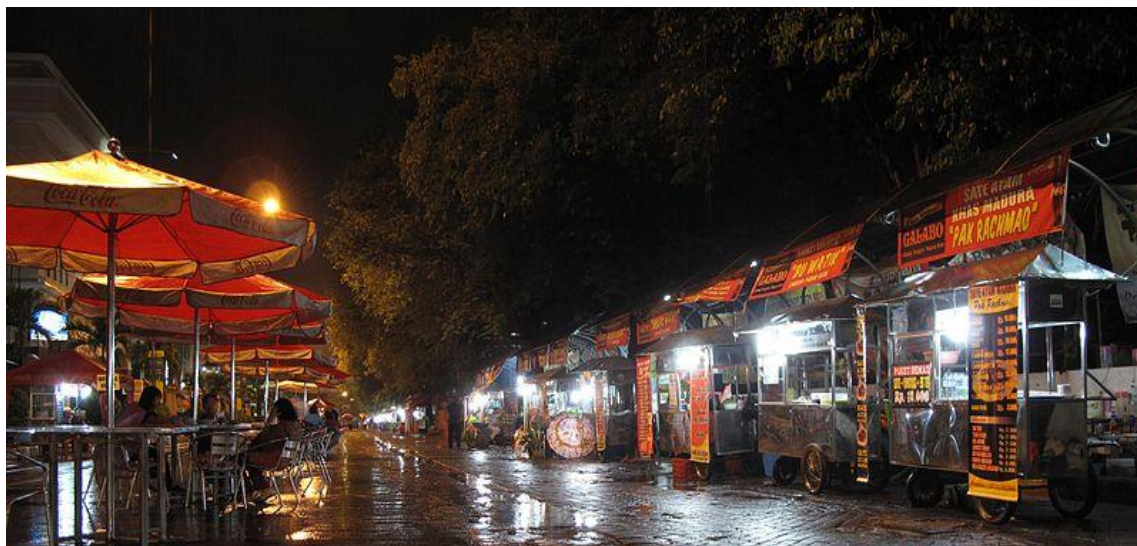
Gambar 6. Kawasan Wisata Kuliner Galabo Surakarta di malam hari

Lokasi pusat kuliner Galabo ini tepatnya berada di sepanjang jalan Mayor Sunaryo Surakarta yang juga merupakan jalur wisata kereta Solo-Wonogiri.