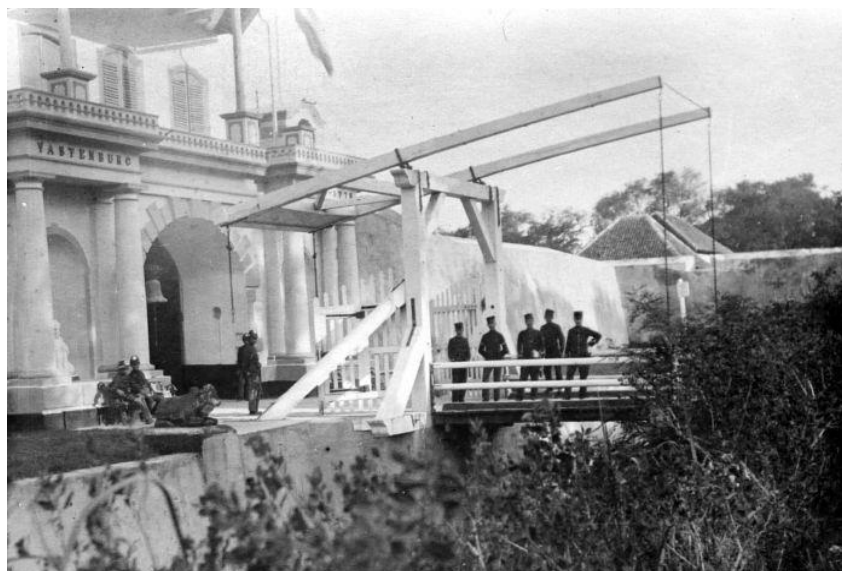
Gambar-4. Jembatan Jungkit di atas parit dan di depan pintu gerbang

Dengan adanya parit yang mengelilingi tembok benteng, maka akses masuk ke dalam benteng hanya bisa melalui 2 pintu gerbang yaitu pintu gerbang barat dan pintu gerbang timur. Di depan pintu gerbang ada jembatan untuk menyebrangi parit. Jembatan ini dulu aslinya berbentuk jungkit dan sewaktu-waktu bisa diangkat-turunkan, tapi sekarang sudah berubah menjadi jembatan permanen dari beton (Gambar 4).