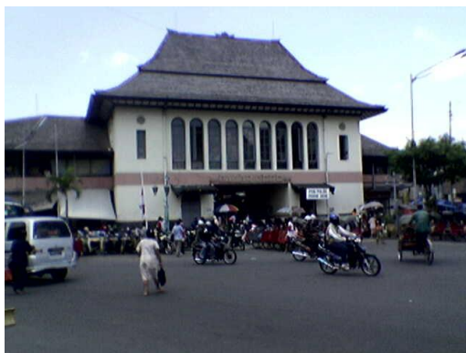
Gambar 9. Gedung Pasar Gede bernuansa Kolonial

Pasar tradisional “Pasar Gede” merupakan kawasan pecinan yang bentuk bangunannya bernuansa kolonial (Gambar 9).