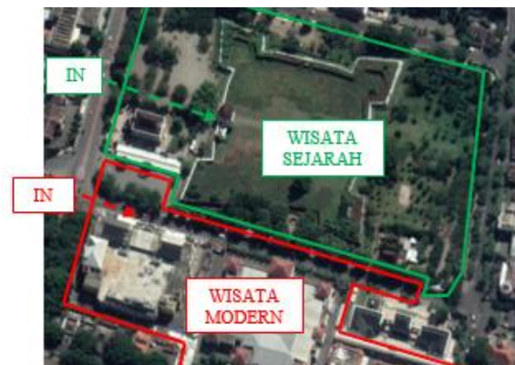
Gambar-10. Dua Komplek Wisata Terpisah

Dari data-data yang telah didapatkan, terlihat bahwa secara fisik antara obyek wisata Benteng Vastenburg dengan obyek wisata modern sekelilingnya tidak ada akses yang menghubungkan. Kedua kompleks wisata ini terpisah oleh pagar pembatas dan satu gedung perkantoran bank. Akses masuknya sendiri-sendiri dan terletak di titik lokasi yang berjauhan. Disamping itu tidak ada satupun fasilitas bersama yang digunakan oleh kedua obyek ini, misalnya ruang parkir, toilet umum, ataupun tempat ibadah. Hal ini menyebabkan masing-masing obyek terisolasi satu dengan lainnya (Gambar-10)