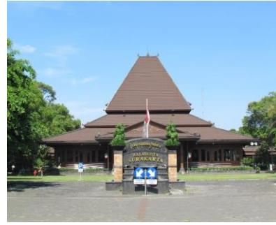
- Gedung Balaikota Surakarta