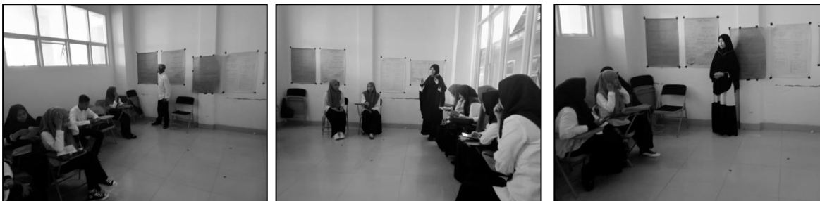
Gambar 4. Presentase dan Diskusi Kelompok

Gambar 3 di atas menjelaskan bahwa hasil kelompok 1-5 lima dalam membuat jalur pembuatan makalah dalam kertas manila, untuk selanjutnya dipresentasikan. Adapun presentase alur pembuatan makalah ini, dapat dilihat pada gambar 4 berikut: