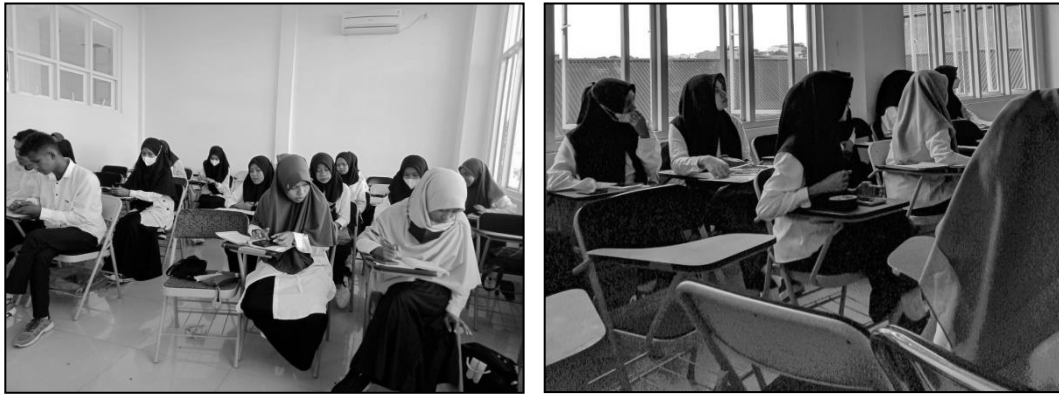
Gambar 1. Pemberian tes kerangka pembuatan makalah

Berdasarkan gambar 1 di atas, Dosen memberikan materi tentang cara menulis dan membuat makalah, kemudian mahasiswa diberikan tes awal ( pretest ), agar dapat melihat kemampuan mahasiswa, sejauhmana pemahaman mahasiswa dalam menulis dan membuat makalah yang baik dan benar.