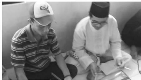
Gambar 2. Kegiatan mendata peserta PKM

pelatihan di Dusun Lengkese. Tim pengabdian bertemu pada hari minggu tanggal 20 Juli 2022, dikarenakan selain hari tersebut baik tim pengabdian dan kepala desa memiliki kesibukan dan kewajiban pada tugasnya masing-masing. Pada tanggal 20 Juli tim pengabdian bertemu dengan Kepala dusun beserta beberapa orang perwakilan dari warga bertemu. Pada kegiatan ini tim pengabdian memberikan penjelasan kepada mitra terkait kegiatan IbM yang akan dilaksanakan, tempat dan waktu pelaksanaan penyuluhan dan pelatihan. Pada pertemuan ini ada beberapa hal yang disepakati, yaitu kegiatan sosialisasi kegiatan IbM, waktu dan tempat pelaksanaan penyuluhan, serta waktu dan tempat pelaksanaan pelatihan pembuatan produk bernilai ekonomis dari limbah plastik. Waktu Pelaksanaan kegiatan pengabdian ini berlangsung selama 2 hari yaitu pada tanggal 10 dan 11 Agustus 2022 dengan jumlah 50 orang peserta, di mana puncak kegiatan dilakukan pada tanggal 11 Agustus 2022.