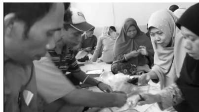
Gambar 3. Kegiatan memisahkan limbah plastik

Persiapan kegiatan ini berupa penyediaan limbah plastik (botol air mineral, gelas air mineral, dll), pembuatan modul penyuluhan dan pelatihan. Modul penyuluhan berisi materi dasar tentang manfaat lain limbah plastik, tehnik pengolaha limbah plastik, dan pemasaran produk. Produk ornament berbentuk bunga, keranjang plastik, pot bunga dari botol plastik (Aminuddin & Nurwati, 2019). Modul pelatihan berisi tentang bahan-bahan, alat-alat dan cara pembuatan produk tersebut.