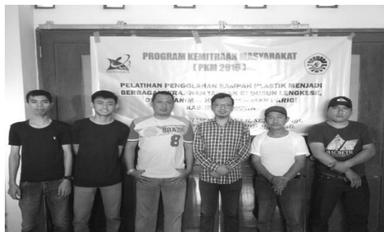
Gambar 1. Foto bersama Ketua Kelompok UKM Dusun Lengkese dan beberapa peserta PKM

Kegiatan pengabdian ini dilakukan di Dusun Lengkese, Desa Manimbahoi, Kecamatan Parigi, Kabupaten Gowa, dengan sasaran warga Dusun Lengkese Desa Manimbahoi, Kecamatan Parigi, di Kabupaten Gowa. Kegiatan pokok dalam program pengabdian ini adalah pelatihan serta pendampingan pembuatan bernilai ekonomis yang berasal dari limbah plastik yang tidak terpakai serta ketrampilan memasarkan produk tersebut dengan prinsip learning by doing (Mappiare, 1983; Anwar & Heryadi, 2004; Rochman, 2005).