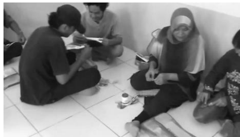
Gambar 6. Kegiatan membuat ornamen bunga

Penyuluhan diadakan di rumah salah satu warga Dusun Lengkese, dengan dihadiri oleh warga Dusun Lengkese yang dilaksanakan hari Sabtu tanggal 10 Agustus 2022, dan dilanjutkan pada hari Minggu 11 Agustus 2022. Materi yang disampaikan adalah pengolahan limbah plastik serta peluang usaha rumahan, materi pembuatan produk, pengemasan dan pemasaran produk, khususnya produk hasil kerajinan tangan yang bernilai ekonomis (Sirait, 2009).