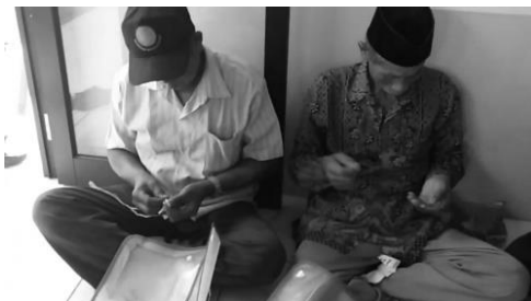
Gambar 7. Kegiatan membuat pot bunga

Pelatihan diberikan dalam bentuk ceramah yang dilanjutkan dengan proses praktek langsung dan tanya jawab. Praktek cara pembuatan pembuatan ornamen berbentuk bunga, keranjang plastik, dan pot bunga dari botol plastik. Warga dibagi ke dalam beberapa kelompok, kemudian dengan dibimbing tim pengabdian mempraktekkan sendiri pembuatan produk tersebut. Pelatihan dilaksanakan sampai semua peserta mahir mempraktekkan sendiri (Nurazizah dkk., 2021).