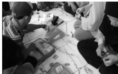
Gambar 4. Kegiatan memilah limbah plastik yang layak dipakai

Alat dan bahan yang dibutuhkan pada pelatihan pembuatan ornament berbentuk bunga, keranjang plastik, dan pot bunga dari botol plastik, antara lain botol plastik bekas dan gelas air mineral bekas, cutter, lem, pewarna, label kertas, pisau, gunting dan wadah plastik besar.