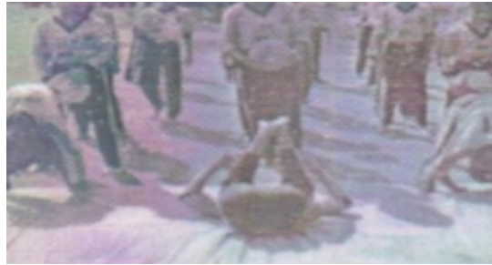
Gambar 2. 4. Modifikasi beranting sentuh pundak tangan

Setelah anak tersebut mempraktikkan gerakan mengguling ke depan maka segeraberdiridalewatsampingbarisan kelompok untukberlarimenuju posisibarisandipalingbelakang sampai posisibelakangmelakukangerakansentuh pundak sepertiawal.