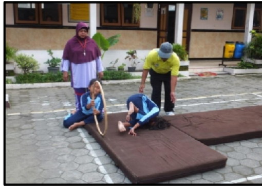
Gambar 2. 3.

Cara bermain dengan anak di bagimenjadi 2 kelompok masing-masing dari kelompok salah satu anak bertugas memegang simpai di atas matras dan anak yang lain siap-siap untuk melakukan. Lomba masuk kata melewati untuk mencoba mempraktekkan gerakan mengguling kedepan. Gerakan kombinasi masuk kata melewati simpaian dan mengguling kedepan dilakukan dengan cara jongkok, masuk ke dua tangkai ke dalam simpai, dan selanjutnya melakukan gerakan mengguling kedepan di atas matras.