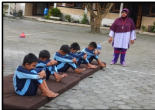
Gambar 2. 2. Permainan kapal goyang

Cara bermain adalah dengan siswa berbaring di atas matras menghadap ke atas, kemudian kedua lutut di pegang menggunakan kedua tangan, dengan posisi kedua tangan saling mengkait lutut kaki, waktu melakukan gerakan kapal goyang tengkukanak berusaha menyentuh kedua lutut kaki tanpa melepaskan kaitan tangan dan berusaha bergerak maju ke depan dan belakang.