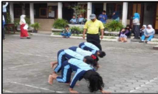
Gambar 2. 1. Modifikasi Permainan Galah Berjalan dengan Median Kertas

Cara bermain adalah dengan siswa dibagi menjadi dua kelompok, tiga siswa adalah berjalan menirukan gajah, berjalan dengan kedua tangan dan kedua kaki, dagu ditempelkan di dada sambil menjepit kertas, tangan dan kaki lurus berjalan dari titik A ke titik B (jarak titik A sampai titik B jangan terlalu jauh), di lakukan dengan cara estafet. Saat berjalan usahakan kertas tetap di jepit di dada menggunakan dagu dan kertas jangan sampai jatuh/lepas.