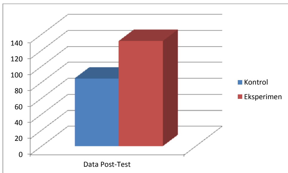
Gambar 3. Grafik motivasi belajar sesudah perlakuan