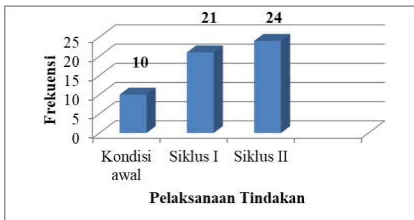
Gambar 1. Grafik Ketuntasan Hasil Belajar Siswa Kelas V SDN 2 Nadi Pokok Bahasan Gaya Ranah Afektif pada Kondisi Awal, Siklus I dan Siklus II