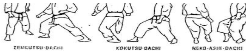
Gambar 1. Kuda-kuda dalam karate