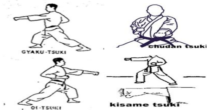
Gambar 2. Pukulan Dalam Karate