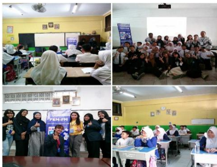
Gambar 2. Dokumentasi kegiatan

Monitoring dan Evaluasi. Kegiatan dilaksanakan pada tanggal 21 September 2023. Kegiatan ini meliputi pemaparan tahapan atau rangkaian program yang telah berjalan, penyerahan surat dan lembar pertanggung jawaban program serta kegiatan validasi kegiatan program yang telah dijalankan meliputi tanda tangan dan stempel (cap). Dalam kegiatan pengkaderan terdapat umpan balik dari mitra terkait kekurangan dan kelebihan tahapan program yang telah berjalan. Kegiatan ini juga berupa pengukuran pengetahuan guru tentang teknologi berupa Post-Test dan observasi selama kegiatan berlangsung.