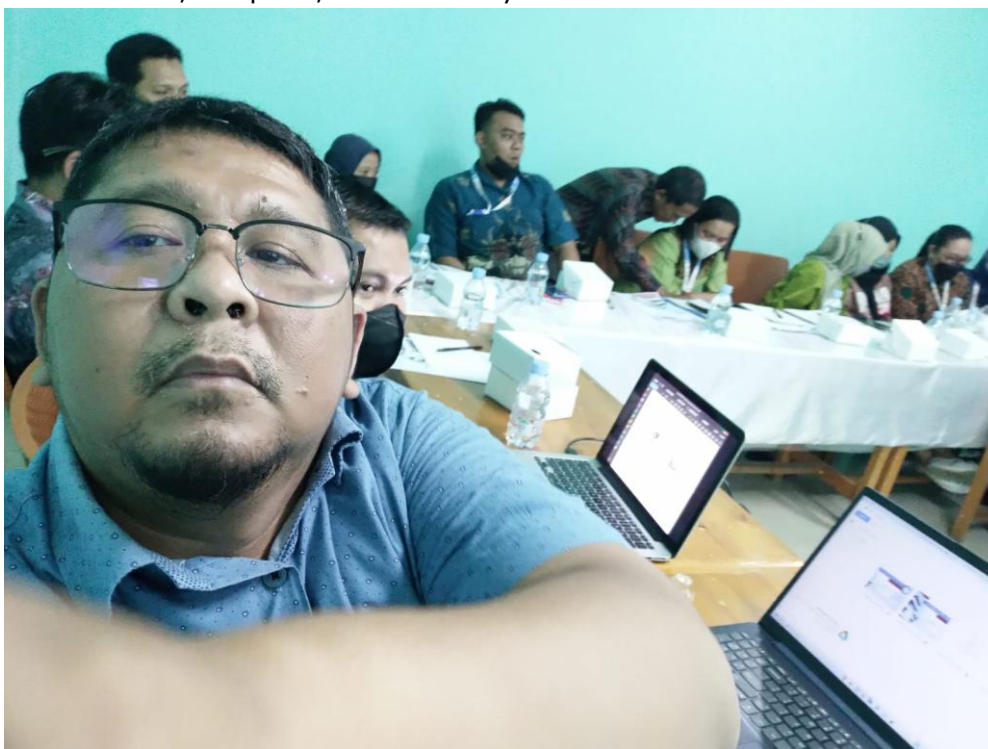
Gambar 2. Pemberian Materi Tentang Manfaat Teknologi dalam Bidang Bisnis UMKM

Pada tahap ini, tim pengabdian memberikan materi terkait pentingnya perkembangan teknologi dalam dunia usaha atau bisnis. Teknologi yang berkembang pesat telah memungkinkan para pengusaha dapat melayani pelanggan dengan waktu yang cepat. Teknologi juga telah membantu meningkatkan efisiensi dan produktivitas di sektor bisnis UMKM seperti sayur mayur. Sistem Informasi e-sayur mayur adalah suatu sistem informasi yang dirancang khusus untuk mendukung dan mengelola operasional bisnis sayur mayur secara elektronik atau daring. Sistem ini mengintegrasikan teknologi informasi dengan proses bisnis UMKM sayur mayur untuk meningkatkan efisiensi, kecepatan, dan kualitas layanan.