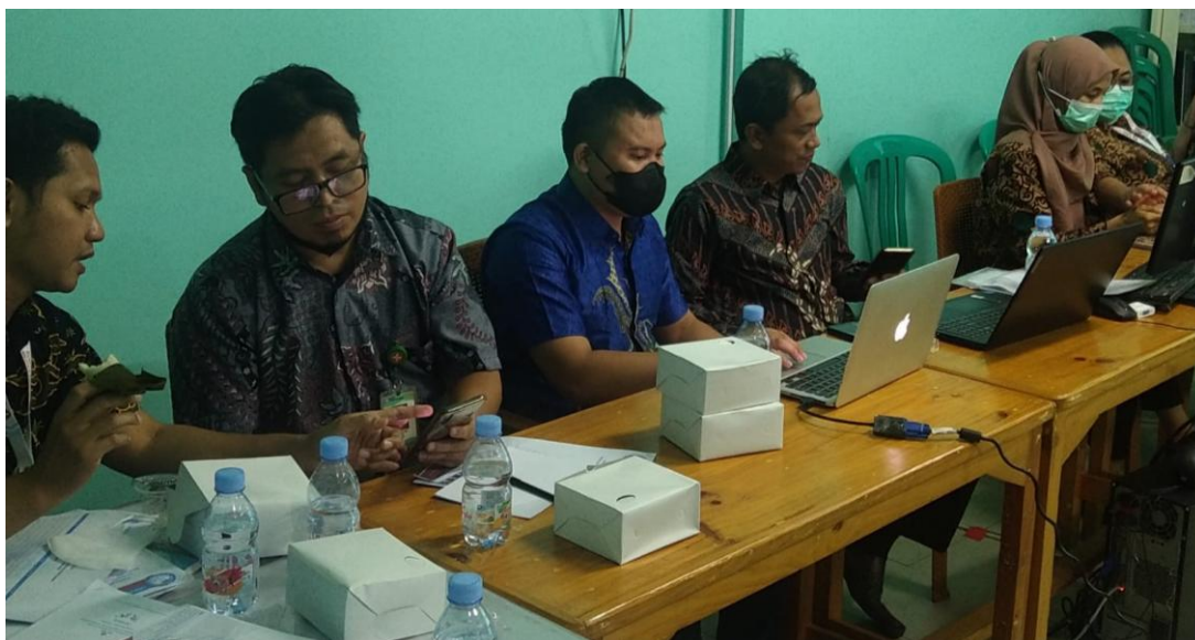
Gambar 4. Praktik Penggunaan Sistem Informasi E-Sayur Mayur

Praktik instalasi sistem informasi e-sayur mayur serta cara penggunaan sistem ditampilkan dalam bentuk video menggunakan LCD proyektor. Hal ini dilakukan agar para peserta pelatihan dapat mengikuti dengan mudah langkah-langkah instalasi aplikasi pada smartphone masing-masing peserta. Praktik instalasi dan penggunaan sistem e-sayur mayur ditunjukkan pada gambar berikut: