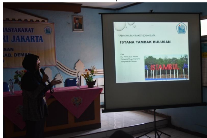
Gambar 5. Pelatihan Pembuatan Paket Wisata