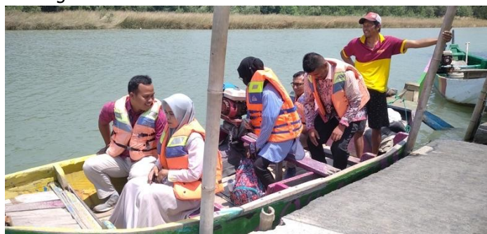
Gambar 1. Tim PKM Naik Perahu dari Dermaga ke Pantai Glagah Wangi Istana Tambakbulusan

Lokasi kegiatan pengabdian ini dilakukan kepada Kelompok Sadar Wisata (Pokdarwis) di Desa Wisata Pantai Glagah Wangi Tambakbulusan.