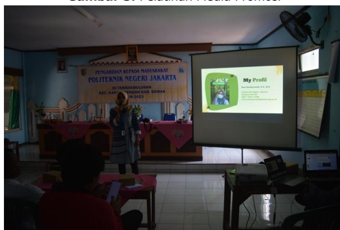
Gambar 4. Pelatihan Kependuan Wisata