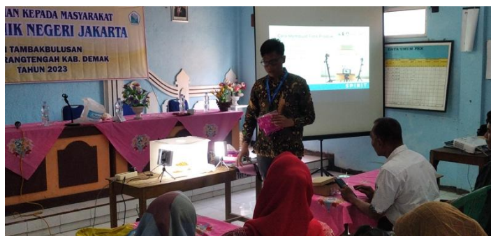
Gambar 3. Pelatihan Media Promosi

Keterampilan peserta pelatihan diobservasi saat pelatihan melalui hasil akhir atau post test dari hasil pelatihan media promosi, kependuan wisata, pembuatan paket wisata yang dikumpulkan.