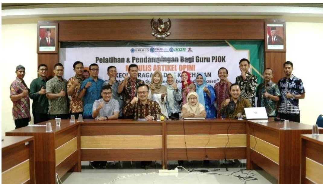
Gambar 6. Peserta dan narasumber berfoto bersama.