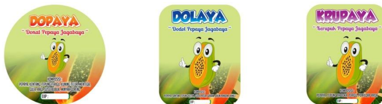
Gambar 6. Desain Label Produk