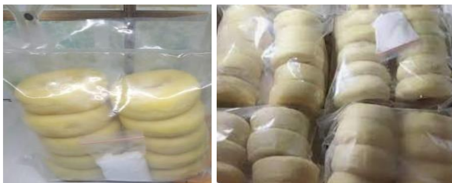
Gambar 4. Hasil Produk Olahan Donat Pepaya