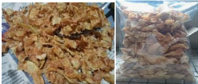
Gambar 5. Hasil Produk Olahan Keripik Pepaya