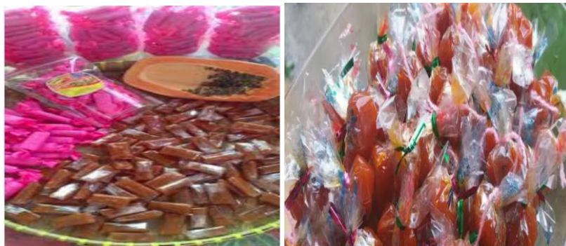
Gambar 3. Hasil Produk Olahan Dodol Pepaya