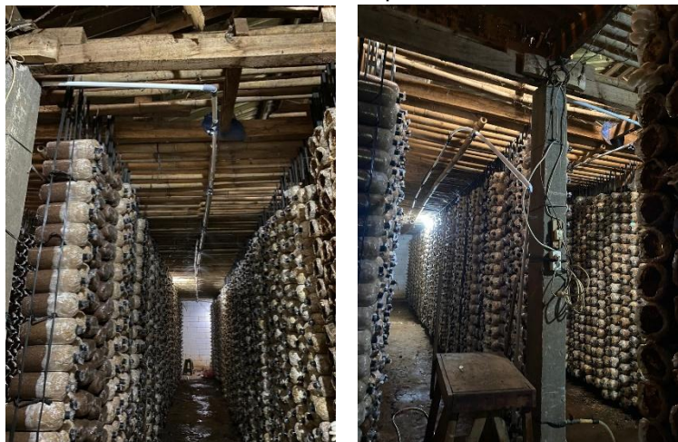
Gambar 2 Aplikasi Alat Penyiram Otomatis di Ruang Kumbung Jamur Tiram

Realisasi pemecahan masalah mitra adalah melakukan penerapan alat siram dan monitoring kelembaban otomatis kumbung budidaya jamur tiram di menawan gebog kudas. Untuk gambar penempatan dapat dilihat di Gambar 2.