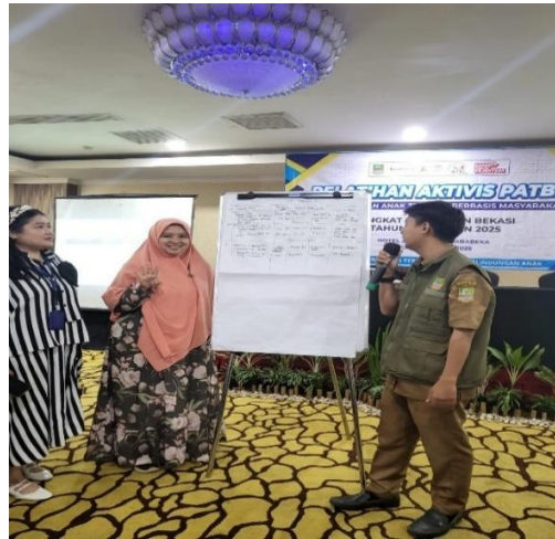
Gambar Pendampingan fasilitator terhadap kelompok peserta dalam merencanakan kegiatan PATBM yang akan dilaksanakan di Desa masing - masing.