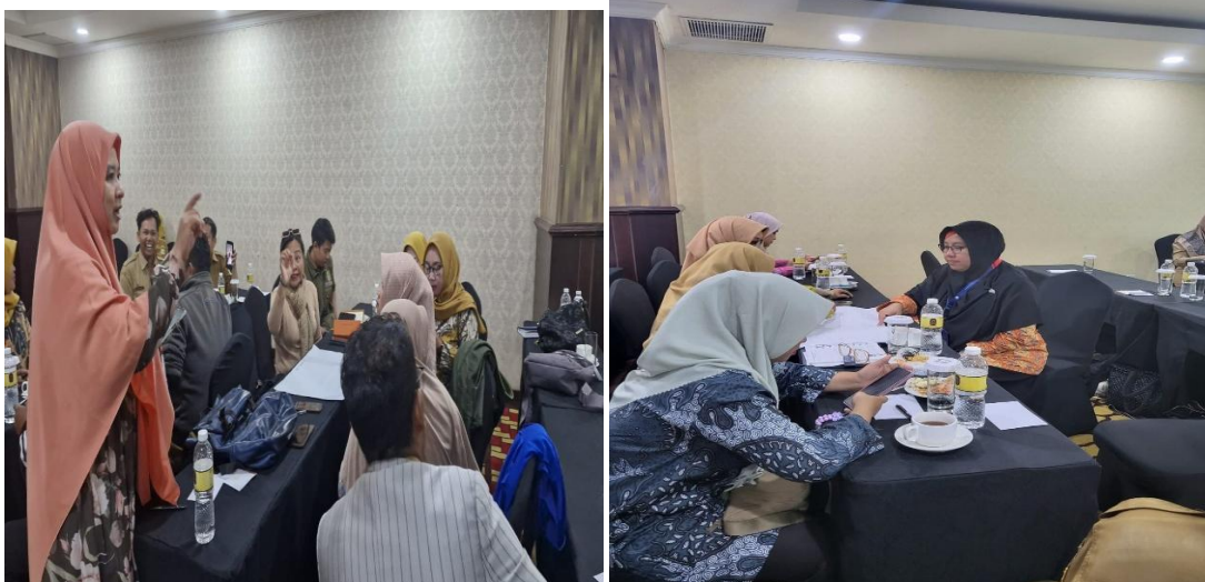
Gambar Kegiatan pengisian kuesioner Pretest tentang perlindungan anak terpadu berbasis Masyarakat (PATBM).

Berikut ini adalah beberapa dokumentasi kegiatan pelatihan aktivis PATBM Kabupaten Bekasi Tahun 2025 :