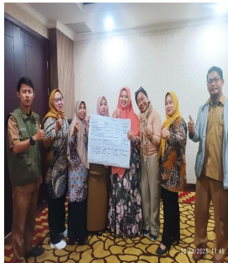
Gambar Penentuan jenis kegiatan PATBM oleh kelompok peserta yang akan dilaksanakan di Desa masing - masing