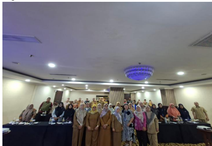
Gambar Pengisian Post test serta penutupan dari kegiatan pelatihan aktivis kegiatan PATBM