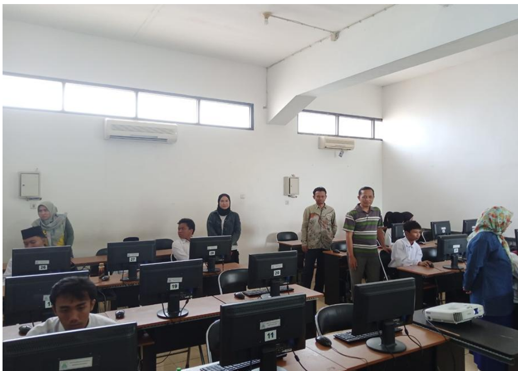
Gambar 3. Pendampingan Pelatihan