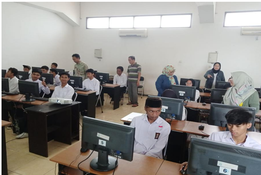
Gambar 4. Pendampingan Pelatihan