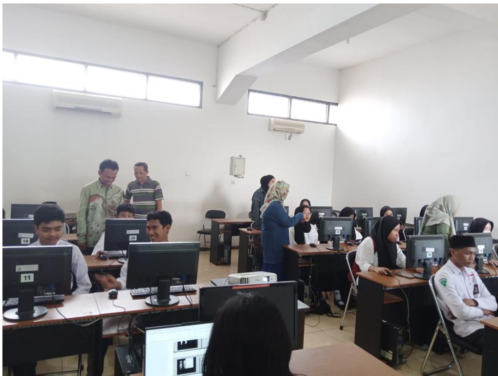
Gambar 2. Suasana Pelatihan