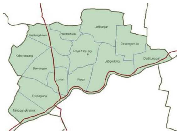
Gambar 1. Peta mezzo kecamatan Ploso

Desa Ploso memiliki potensi wisata yang mendukung perekonomian desa berupa kondisi keaslian desa, budaya dan lokasi wisata. Aspek tersebut memiliki peran dalam perkembangan desa wisata secara umum menurut beberapa sumber yang menjabarkan kebutuhan sebuah desa wisata yaitu suasana keaslian pedesaan (MacCannell, 1973., Wang, 1999), Kesesuaian dengan budaya setempat (UNESCO, 2012., Pitana, 2009) dan Akomodasi (Wijaya dkk, 2020., Suryawan, 2019.). Dari keterkaitan kondisi Desa Ploso dan literatur terkait aspek pendukung Desa Wisata, dapat dijelaskan lebih lanjut bahwa Desa Ploso telah memiliki aspek yang mendasar dalam pengembangan desa wisata. Namun, untuk mengembangkan Desa Ploso sebagai desa wisata yang dapat mendukung perekonomian masyarakat desa secara luas, diperlukan aspek-aspek lain yang juga diperlukan diantaranya adalah Fasilitas pendukung lokasi wisata (Wahyuni, 2019., Lane, 1994), Sifat khas (Prentice, 1993), Partisipasi Masyarakat dalam pengembangan Budaya (Prasiasa, 2017) dan Fasilitas Pendukung Atraksi Budaya (Wijaya, 2020).