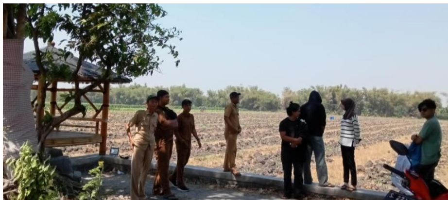
Gambar 4. Survey tapak kawasan wisata kedok sandur

(Dosen Arsitektur). Proses perancangan menitikberatkan pada kegiatan musyawarah dan diskusi antara ketiga pihak utama untuk menggali masalah, potensi dan solusi dari rancangan kawasan wisata Kedok Sandur. Secara garis besar, proses perancangan dibagi menjadi 3 tahapan utama yaitu Proses pengumpulan data lapangan yang kemudian dilanjutkan dengan proses analisa data lapangan tersebut menjadi usulan rancangan, selanjutnya tahapan terakhir adalah penyempurnaan usulan rancangan melalui diskusi bersama dengan Pihak Desa, Masyarakat Desa dan ITN Malang. Proses tersebut merupakan tahapan yang diadaptasi dari tahapan perancangan Jones (1992) dan dikembangkan sesuai dengan kebutuhan proses perancangan spesifik dari kegiatan pengabdian.