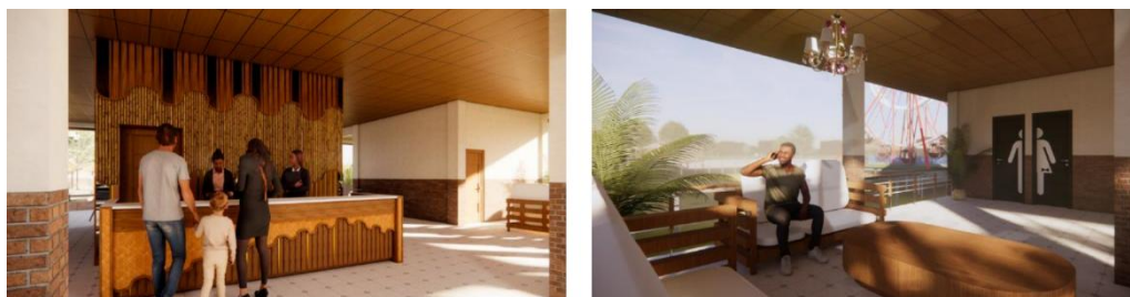
Gambar 11. Interior lobby.