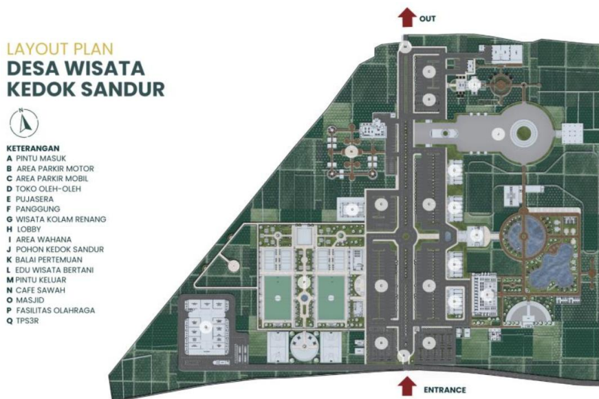
Gambar 12. Layout kawasan yang memuat fasilitas kawasan wisata.