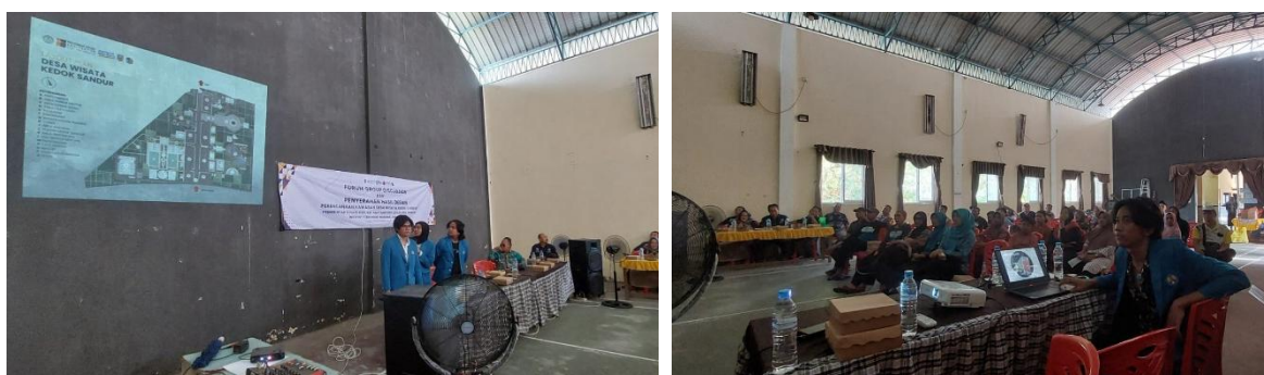
Gambar 6. Kegiatan FGD akhir