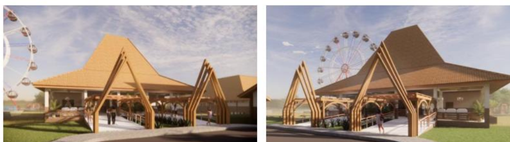
Gambar 7. Fasad bangunan lobby

Pengembangan identitas kawasan wisata didasari oleh budaya tradisional Desa Ploso yang terwujud pada aplikasi material tradisional dan tanggap terhadap kondisi lingkungan tapak. Komponen tersebut diaplikasikan pada beberapa bangunan di kawasan wisata antara lain Fasad Bangunan Lobby dan Fasad Bangunan Café. Fasad bangunan lobby dan café mempertimbangkan penerapan material alami berupa kayu dengan pola alami untuk mendukung kesan bangunan tradisional, serta pengembangan bentuk geometris yang tegas dan sederhana untuk mendukung kesan modern pada bangunan, sehingga kombinasi material dan bentuk sederhana akan mendukung penguatan tema tradisional modern pada bangunan. Penyesuaian pada kondisi lingkungan bangunan diwujudkan pada aplikasi sun shading pada bangunan. Kondisi kawasan yang memiliki tingkat paparan matahari tinggi pada beberapa titik spesifik pada waktu yang spesifik menuntut adaptasi bentuk bangunan yang dapat merespon kebutuhan tersebut. Elemen pelindung merupakan salah satu solusi dalam merespon kondisi lingkungan untuk mendukung kenyamanan pengunjung pada bangunan terhadap efek negatif paparan matahari pada bangunan.