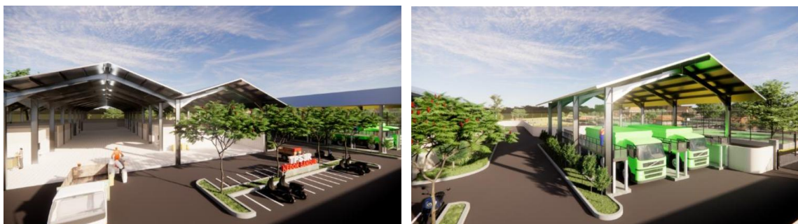
Gambar 13. Rancangan TPS kawasan wisata kedok sandur

yang memiliki nilai ekonomi bagi masyarakat dan pemerintah desa. Motivasi masyarakat tersebut menjadi dasar dalam pengembangan rancangan kawasan wisata yang memiliki fungsi tambahan berupa area pengelolaan sampah masyarakat guna menghasilkan produk dengan nilai ekonomi lebih pada kawasan. Diskusi yang dilakukan bersama dengan pihak desa dan masyarakat Desa Ploso menghasilkan ide berupa penambahan fasilitas TPS pada kawasan yang dapat menampung dan mengolah sampah menjadi produk bernilai ekonomi. Fasilitas TPS tersebut kemudian menjadi dasar dalam pengembangan rancangan kawasan wisata yang semakin lengkap dengan adanya fasilitas pengolahan sampah tersebut. Rancangan TPS dibuat berdasarkan analisa kegiatan dengan