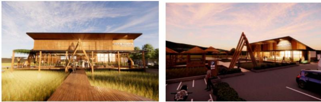
Gambar 8. Fasad bangunan cafe