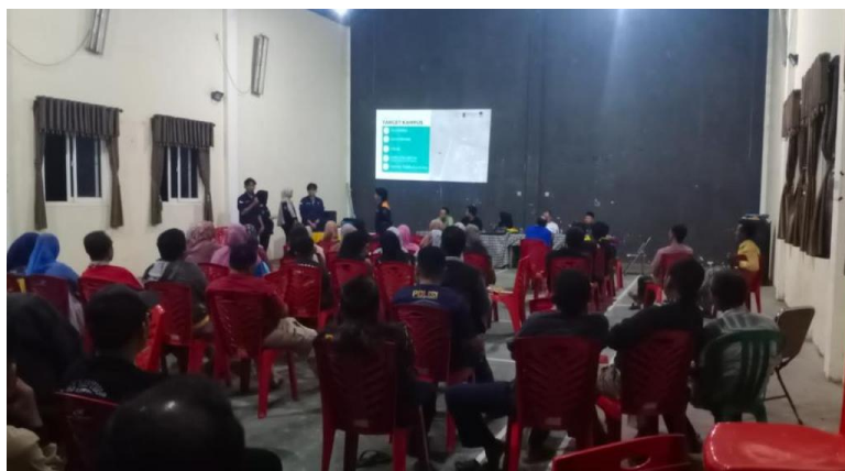
Gambar 5. Kegiatan FGD tahap 1 dengan pemerintah desa & masyarakat Desa Ploso

Proses terakhir yang dilaksanakan adalah pemaparan produk rancangan secara keseluruhan yang telah dikembangkan berdasarkan masukan dari tahap sebelumnya. Pada proses FGD Akhir tersebut, usulan rancangan terbaru diterima dengan baik oleh masyarakat sehingga produk rancangan sudah dapat dikategorikan sebagai produk rancangan yang telah mendapat persetujuan dari pihak desa dan masyarakat. Terpenuhinya kebutuhan masyarakat yang diwadahi dalam Rancangan Kawasan Wisata Kedok Sandur menjadi indikator keberhasilan kegiatan pengabdian yang dapat bermanfaat bagi Desa Ploso. Rancangan tersebut selanjutnya akan menjadi acuan dalam pengembangan pembangunan kawasan wisata yang akan dilaksanakan oleh Desa Ploso pada periode pembangunan di masa mendatang.