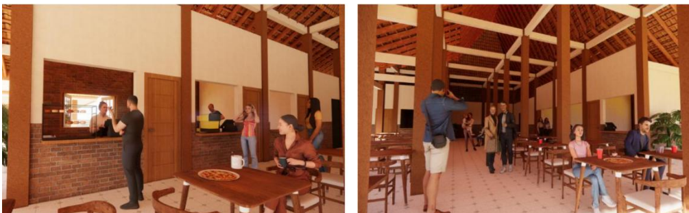
Gambar 9. Interior pujasera.

Elemen interior bangunan menggunakan material dominan kayu dengan motif alami yang diaplikasikan secara minimalis sebagai wujud penerapan tema pada bangunan. Aplikasi material pada rancangan diharapkan dapat menunjang karakter identitas dari kawasan yang telah terwujud dalam bentukan bangunan. Penerapan material juga berfungsi sebagai elemen pembentuk suasana ruang pada bangunan sehingga kesan tradisional yang ditampilkan secara minimalis dapat ditangkap oleh pengunjung kawasan wisata. Penerapan material dapat meningkatkan kenyamanan pengguna terhadap bangunan dengan menghadirkan elemen dan motif fraktal dari elemen alam sebagai komponen interior bangunan.