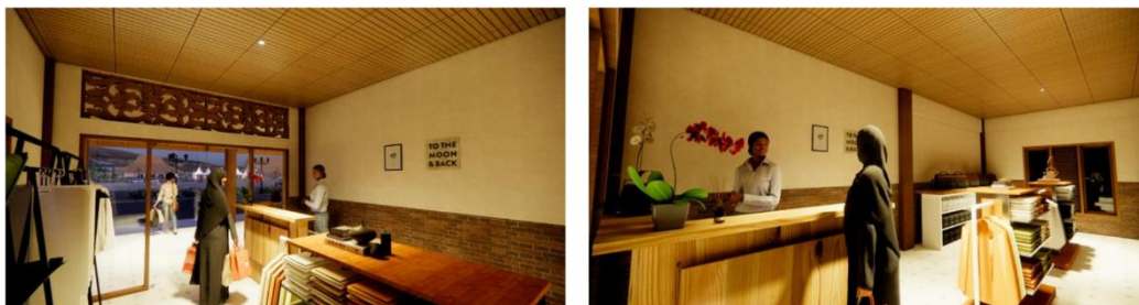
Gambar 10. Interior pusat oleh-oleh.