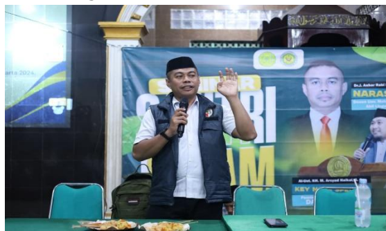
Gambar 5: Momen saat pemateri sedang menjelaskan materi.

Sesi kelima membahas konsep jejak digital ( digital footprint ) dan keamanan informasi pribadi. Materi ini menjadi penting karena sebagian besar peserta belum menyadari bahwa aktivitas digital yang mereka lakukan meninggalkan rekam jejak yang dapat ditelusuri oleh pihak lain. Kesadaran ini mendorong peserta untuk lebih berhati-hati dalam menggunakan media sosial. Peningkatan pemahaman peserta mengenai jejak digital dari 36% menjadi 88% menunjukkan bahwa materi yang diberikan berhasil meningkatkan kesadaran mereka terhadap pentingnya keamanan digital.