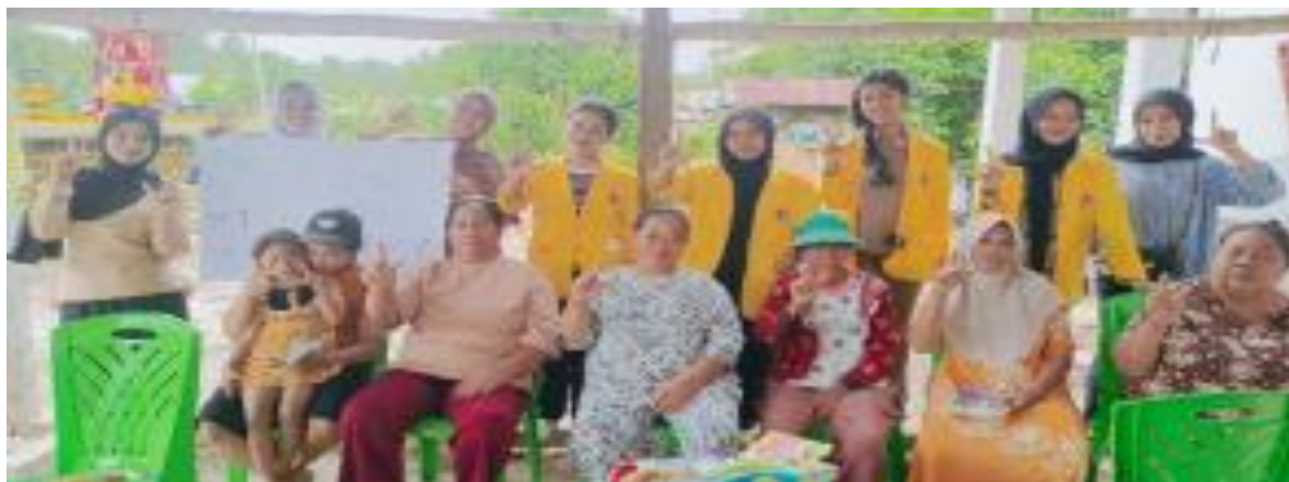
Gambar 2. Observasi Kegiatan Program Sekolah Literasi di Kecamatan Lampasio

mengingatkan anak untuk belajar tanpa memberikan bimbingan yang sesuai dengan tahap perkembangan anak. Selain itu, sebagian besar ibu belum memahami bahwa masa golden age merupakan periode penting yang membutuhkan stimulasi belajar secara berkelanjutan di lingkungan keluarga.