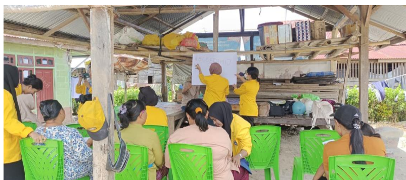
Gambar 4. Memberikan pendampingan belajar

Peserta lainnya mengungkapkan bahwa mereka menjadi lebih sabar dalam mendampingi anak setelah memahami karakteristik perkembangan anak usia dini. Pemahaman tersebut mendorong ibu menggunakan pendekatan bermain sambil belajar sehingga proses pembelajaran menjadi lebih menyenangkan dan sesuai dengan kebutuhan anak.