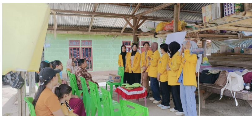
Gambar 3. Observasi Pelaksanaan Penyampaian Materi Program Sekolah Literasi

Program Sekolah Literasi dilaksanakan melalui pembelajaran literasi dasar yang dipadukan dengan materi mengenai pengasuhan dan pendampingan belajar anak usia dini. Kegiatan dilakukan menggunakan pendekatan partisipatif melalui pembelajaran membaca dan menulis secara bertahap, praktik langsung mendampingi anak belajar, diskusi kelompok, serta pendampingan intensif oleh fasilitator. Selama pelaksanaan kegiatan, peserta menunjukkan antusiasme yang tinggi, aktif berdiskusi, bertanya, serta saling berbagi pengalaman mengenai kendala yang dihadapi dalam mendampingi anak belajar di rumah.