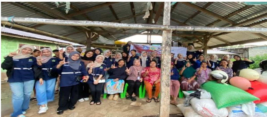
Gambar 5. Dokumentasi Akhir Kegiatan Program Sekolah Literasi

Gambar 5 merupakan dokumentasi akhir pelaksanaan Program Sekolah Literasi di Kecamatan Lampasio, Kabupaten Tolitoli, yang melibatkan tim pelaksana pengabdian bersama ibu-ibu peserta. Dokumentasi ini menunjukkan tingginya partisipasi masyarakat selama kegiatan berlangsung serta terjalannya kerja sama yang baik antara tim pengabdian dan peserta dalam setiap tahapan pelaksanaan program.