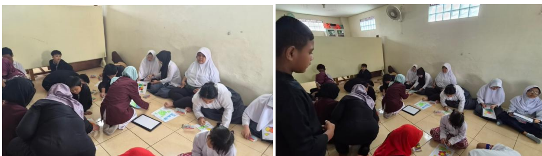
Gambar 4 Foto Kegiatan Pelatihan Mewarnai di SLBC Karya Bhakti

Kegiatan ini berlangsung dengan lancar dan mendapat antusiasme yang tinggi dari para peserta. Selama pelatihan, anak-anak mengikuti berbagai aktivitas mewarnai yang dirancang untuk meningkatkan kreativitas, kemampuan motorik halus, serta memberikan pengalaman belajar yang menyenangkan. Seluruh rangkaian kegiatan berjalan sesuai dengan agenda yang telah direncanakan dan diakhiri dengan sesi dokumentasi bersama peserta, guru pendamping, dan tim pelaksana. Dokumentasi kegiatan tersebut selanjutnya dipublikasikan melalui media sosial sebagai bentuk diseminasi dan publikasi kegiatan pengabdian kepada masyarakat.