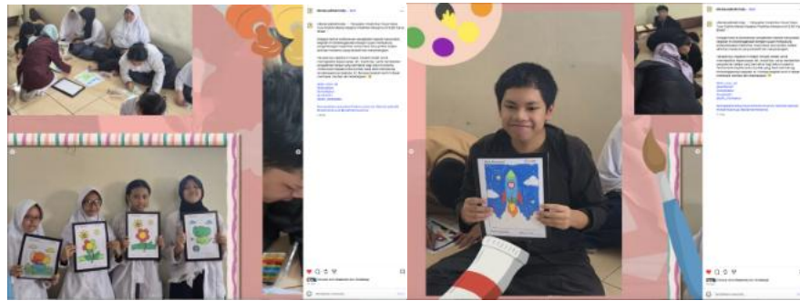
Gambar 5 Publikasi kegiatan melalui instagram sekolah

indikator keberhasilan pelatihan dalam mengembangkan kreativitas dan keterampilan motorik halus peserta, tetapi juga menjadi media untuk meningkatkan rasa percaya diri dan apresiasi terhadap kemampuan yang dimiliki oleh masing-masing siswa. Sebagai bentuk penghargaan atas kreativitas peserta, seluruh hasil mewarnai didokumentasikan dan dipublikasikan melalui akun Instagram resmi SLBC Karya Bhakti. Publikasi ini diharapkan dapat memberikan ruang apresiasi bagi karya siswa sekaligus meningkatkan kesadaran masyarakat terhadap potensi dan kemampuan anak-anak berkebutuhan khusus dalam bidang seni dan kreativitas.