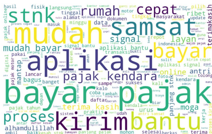
Gambar 3. World Cloud Ulasan Positif

Berdasarkan tabel 4 maka diketahui bahwa hasil kalsifikasi terbaik diperoleh pada skenario 1 dengan menggunakan kernel polynomial. Nilai akurasi mencapai 92,2% dan nilai precision 97,21%. Sedangkan untuk nilai recall 97,2% dan f1-score mencapai 97,19%. Sedangkan untuk kata-kata yang sering muncul pada ulasan aplikasi SIGNAL dapat dilihat pada gambar 4 dan gambar 5.