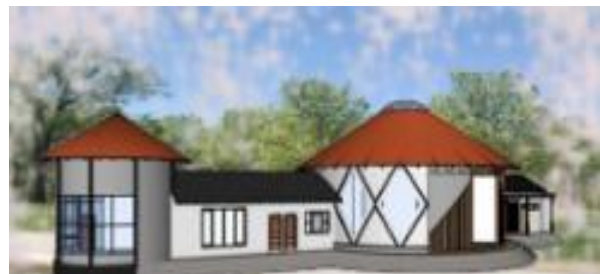
Gambar 10. Kantor Pengelola

Ide bentuk yang diambil pada denah kantor pengelola adalah Kudi, yaitu senjata khas Banyumas. Atap menggunakan bentuk Tajug yang dikombinasikan dengan bentuk pelana di sisi kanan dan kirinya.