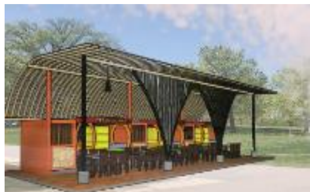
Gambar 14. Warung Makan

Bentuk atap dari warung makan dibuat lengkung bertujuan untuk mengarahkan angin supaya dapat masuk ke dapur dan mengeluarkan udara melalui sela-sela rooster , karena dapur merupakan tempat orang memasak dan udara biasanya berubah menjadi panas.