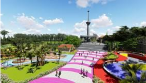
Gambar 7. Plaza Sebagai Penghubung Antar Ruang

terbuka yang digunakan sebagai penghubung antar massa bangunan. Selain plaza , untuk menghubungkan massa bangunan digunakan pergola yang berfungsi sebagai peneduh atau pelindung dari panas dan terik sinar matahari