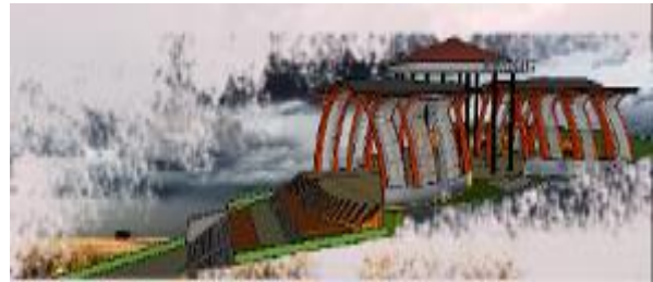
Gambar 9. Foodcourt

Mengambil konsep terowongan supaya anak ketika sedang makan di dalamnya tidak merasa bosan karena mereka seperti bermain di dalam sebuah terowongan.