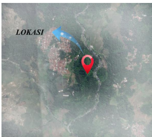
Gambar 2. Peta Lokasi Site Perencanaan

Site atau tapak berada di Jl. Raya Baseh, Desa Sunyalangu, Kecamatan Karanglewas, Kabupaten Banyumas.