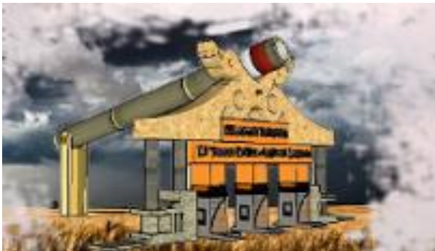
Gambar 12. Tiketing

Salah satu potensi dari Desa Sunyalangu, adalah Kampung Entok. Bentuk bangunan tiketing terinspirasi dari Entok yang sedang bersatu. Pada bagian atas bangunan terdapat salah satu jenis permainan tradisional yaitu meriam bambu yang membenteng.