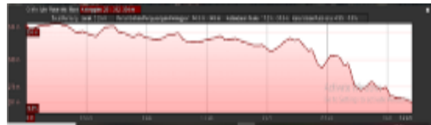
Gambar 3. Kemiringan Site

Site berada pada ketinggian 342 m, tiap garis kontur berbeda ketinggian 5 m. Penambahan/pengurangan ketinggian yaitu sekitar 74,5 m - 145 m, kelandaian maksimal 17,2% - 37,6 %, dan kelandaian rata-rata 4,9 % - 7,6 %.