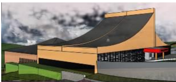
Gambar 8. Museum, Taman Permainan Indoor , Dan Workshop

Wujud bangunan mengambil konsep dari atap Panggang Pe yang dimodifikasi. Atap dibuat sedikit melengkung untuk penghawaan di dalam museum. Sedangkan taman permainan indoor mengambil bentuk atap Joglo dan dibuat 2 lantai dengan mengikuti kontur tanah.