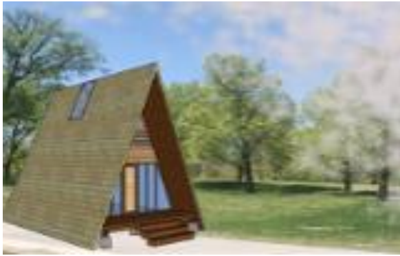
Gambar 11. Penginapan