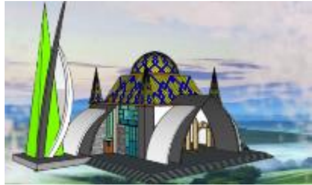
Gambar 13. Masjid