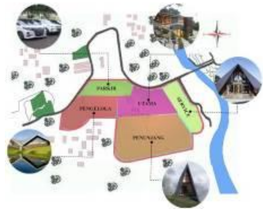
Gambar 5. Analisa Zonifikasi

Konsep yang muncul pada perancangan Traditional Game Park setelah dianalisa zonifikasinya adalah sebagai berikut: