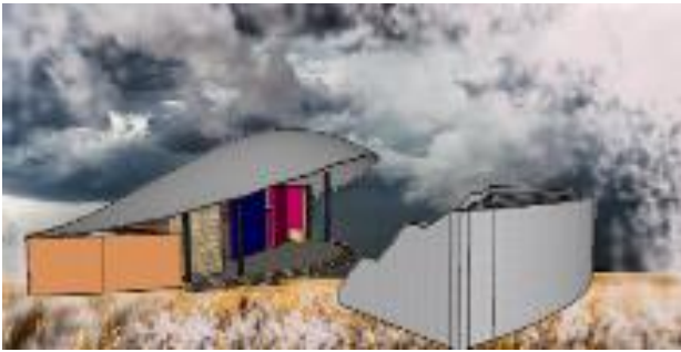
Gambar 15. Amphiteater

c. Konsep Interior Bangunan, mengambil bentuk dari alat mainan yang digunakan dalam permainan tradisional. Contoh penerapannya adalah bentuk sofa yang dibuat seperti dakon dan bekel, sedangkan bentuk mejanya dibuat seperti panggung. Area tempat duduk ini bisa digunakan perorangan maupun berkelompok bersama dengan keluarga.