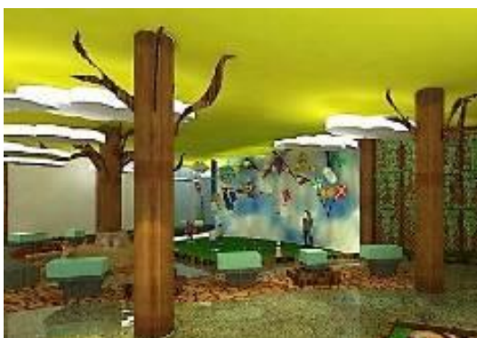
Gambar 16. Interior Permainan Indoor

Untuk area permainan indoor , idenya mengambil suasana hutan yang banyak di sekitar site . Interior ruang dibuat seolah-olah seperti di dalam hutan dengan tumbuhan-tumbuhan yang menjulang tinggi hingga ke plafon. Untuk mengakomodasi semangat anak-anak yang tinggi, maka untuk interior bangunan menggunakan warna-warna yang cerah.