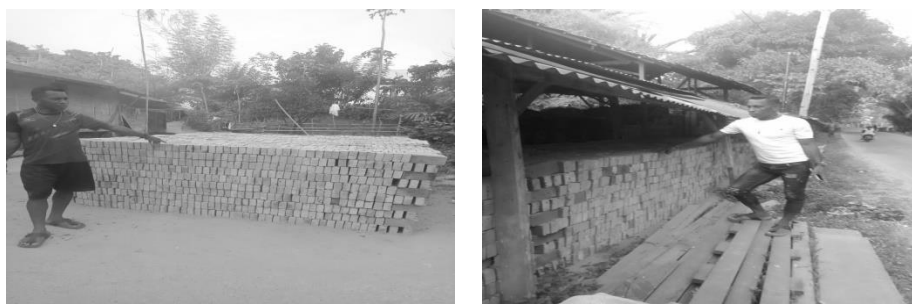
Gambar 1. Lokasi Usaha dan Pemasaran Batu Bata Merah secara Konvensional

Mengacu pada analisis situasi mitra, maka dirumuskan permasalahan yaitu kurangnya pengetahuan mitra tentang sistem pemasaran produk secara digital melalui media sosial untuk meningkatkan peluang pasar serta pendapatan.