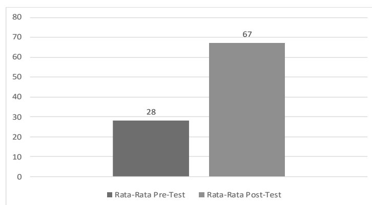
Gambar 3. Rata-Rata Nilai Pre-test dan Post-test Materi Pemasaran Digital

Evaluasi kegiatan materi terkait pemasaran digital lewat media sosial berupa soal pre-test dan post-test dalam bentuk pilihan berganda, dimana hasil analisis ditunjukkan pada Gambar 3 dan Tabel 1.