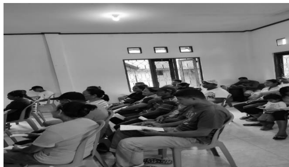
Gambar 2. Kegiatan PkM Literasi Pemasaran Digital

Kegiatan literasi pemasaran digital bagi pengusaha batu bata merah dimulai pukul 10.00 WIT dan diikuti oleh 54 orang pengusaha batu bata merah. Susunan acara kegiatan sebagai berikut: sambutan kepala desa atau disebut Raja Negeri Hatu, ucapan terima kasih oleh Ketua Tim PkM, pembacaan doa oleh anggota tim, dan pelaksanaan kegiatan literasi tentang pemasaran digital (Gambar 2).