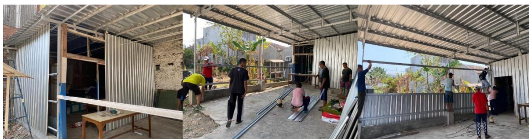
Gambar 6. Kerja bakti pemasangan dinding gudang

Sesuai dengan kesepakatan dengan ketua RT, kegiatan pengabdian ini tidak termasuk penyediaan tenaga kerja tukang untuk pemasangan dinding. Pemasangan dinding gudang dilaksanakan melalui kerja bakti warga. Walaupun material telah didatangkan pada Bulan Agustus, tetapi tidak bisa langsung dikerjakan. Setiap minggu di bulan tersebut sudah ada kegiatan-kegiatan RT/ RW lainnya karena bertepatan dengan bulan kemerdekaan. Kendala yang dihadapi di lapangan adalah susahnya menentukan waktu kerja bakti karena memasuki Bulan September, staf RT dan juga warga ada yang sakit bergantian. Akhirnya, kerja bakti untuk pemasangan dinding Gudang penyimpanan RT ini dilaksanakan di minggu terakhir Bulan September. Berikut adalah dokumentasi foto saat kerja bakti pemasangan dinding.