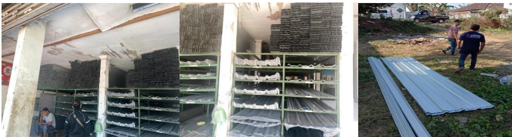
Gambar 5. Pembelian dan pendatanganan material dinding gudang

Tahap selanjutnya setelah mendapatkan rekap kebutuhan material adalah pengadaan material. Pengadaan material dilaksanakan pada Bulan Agustus. Tahap ini terdiri dari survei harga di beberapa toko material, pembelian material, dan pendatanganan material ke lokasi gudang.