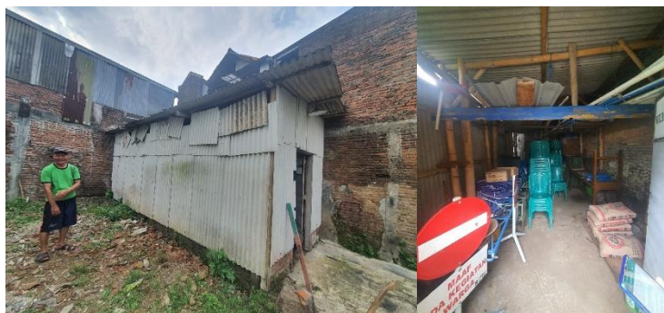
Gambar 1. Kondisi fisik gudang dan barang inventaris RT

Pemilihan material dinding gudang sangatlah beragam. Salah satu material yang murah dan mudah ditemukan adalah galvalume spandek. Material ini digunakan untuk dinding gudang RT 03. Material ini dipilih karena lebih tahan cuaca dan mampu meredam kebisingan (Agerippa Yanuranda Krismani & Yonathan Suryo Pambudi, 2021). Material dinding galvalume spandek memiliki beberapa keunggulan, yaitu mudah dipasang, mudah daam pemeliharaan, ringan, ramah lingkungan, hemat, dan mudah ditemukan (Reyhan Apriathama, 2022). Selain itu, pemilihan material dinding juga didasarkan pada penggunaan material yang sama untuk kanopi baja ringan profil C75 x 0,75 mm yang telah terpasang sebelumnya (Agustin Dita Lestari et al., 2023).