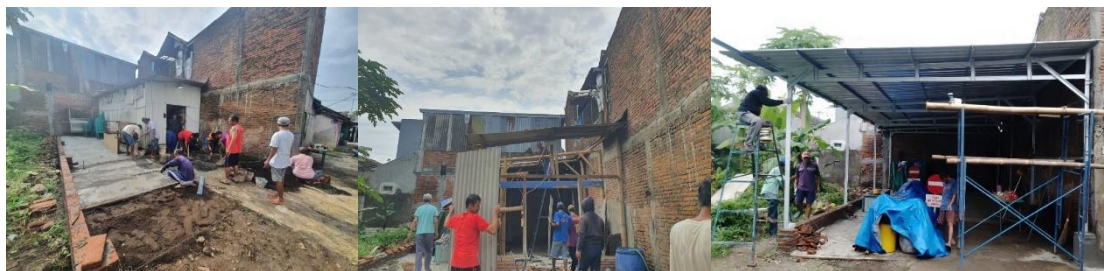
Gambar 2. Kerja bakti perabatan, pembongkaran, dan pemasangan kanopi gudang

Kegiatan perabatan dan pemasangan kanopi ini direncanakan dilaksanakan pada Bulan Juni melalui kerja bakti warga. Kerja bakti dilaksanakan tiga kali setiap minggu karena tidak cukup jika hanya dalam sekali kerja bakti saja. Kerja bakti yang pertama digunakan untuk merabat tanah dan membongkar gudang penyimpanan. Kemudian minggu berikutnya dilanjutkan dengan memasang gudang di layout yang baru dan persiapan pekerjaan pemasangan kanopi. Minggu ketiga kerja bakti, menyelesaikan pemasangan kanopi dan pekerjaan finishing. Berikut adalah hasil-hasil dokumentasi kerja bakti warga merabat tambahan tanah dan pemasangan kanopi tempat pertemuan RT.