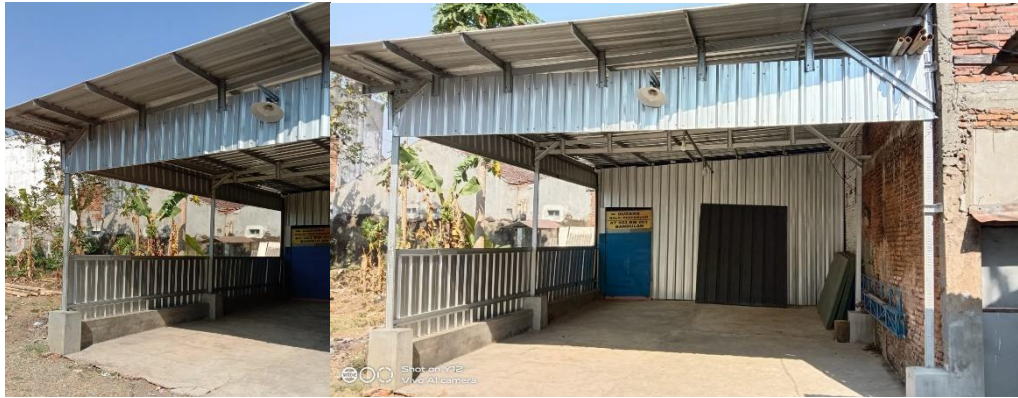
Gambar 7. Kondisi gudang dan tempat pertemuan RT saat ini

Pada akhir kegiatan ketua RT sebagai wakil dari masyarakat diminta untuk mengisi kuesioner. Hasil kuesioner menunjukkan bahwa masyarakat puas dengan kegiatan PPM ini (Gambar 8.). Semua inventaris gudang tersimpan dengan baik di gudang yang nyaman dan lebih tahan laman dibandingkan kondisi sebelumnya. Terlihat bahwa hasil pengisian kuesioner didominasi oleh penilaian SS (Sangat Setuju). Sehingga dapat dikatakan bahwa mitra merasa puas, terbantu, meningkatnya kemandirian, bertambahnya pengetahuan serta keterampilannya.