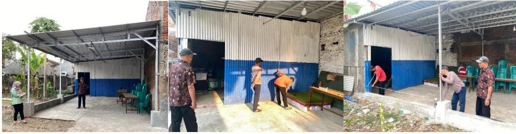
Gambar 3. Kegiatan survei dan pengukuran