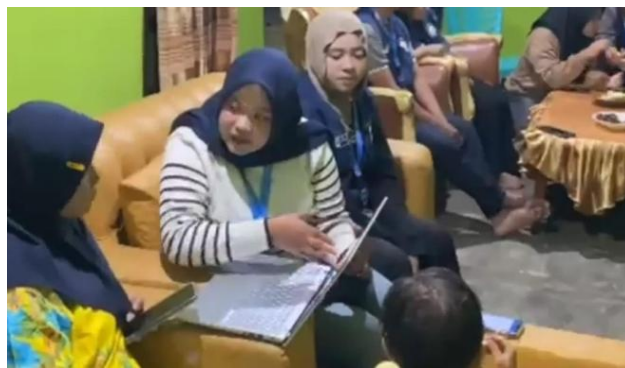
Gambar 3. Pendampingan dalam Pencatatan transaksi melalui Aplikasi SI APIK

Melihat pada tabel 1. Hasil kuantitatif menunjukkan bahwa intervensi literasi keuangan dan aplikasi digital memberikan peningkatan signifikan dalam pemahaman dan praktik pencatatan keuangan oleh pelaku usaha dodol. Peningkatannya sebesar > 60\% dalam pemahaman literasi keuangan. Semua mitra berhasil mencatat transaksi harian melalui aplikasi SI APIK minimal 80% dari total transaksi usaha mereka selama periode pendampingan. Rata-rata waktu pencatatan transaksi menurun dari \pm 5 menit per transaksi (manual) menjadi \pm 1-2 menit dengan SI APIK, menurangi beban administrasi. Temuan ini sejalan dengan penelitian (Aisyah dkk., 2023) yang melaporkan bahwa pelatihan pencatatan keuangan sederhana dengan aplikasi digital (Buku Warung) meningkatkan keterampilan pencatatan pelaku UMKM. Kegiatan pendampingan ini dilakukan oleh mahasiswa/i Universitas Negeri Gorontalo yang merupakan peserta pengabdian kepada masyarakat.