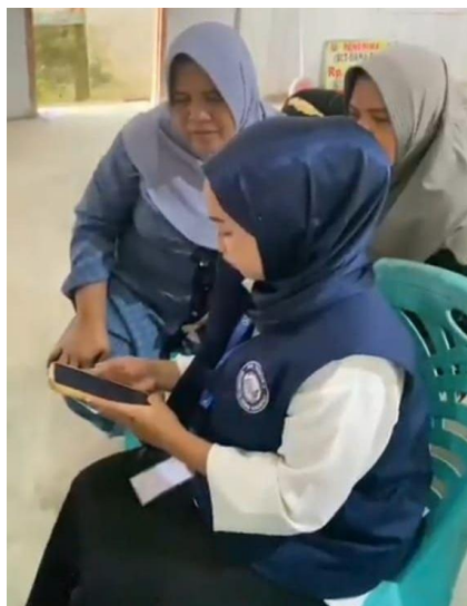
Gambar 4. Pembuatan Aplikasi SI APIK

Pelaksanaan pengabdian berlangsung sangat interaktif dan beberapa mitra sasaran langsung menanyakan manfaat operasional aplikasi pencatatan digital ini, dimana pengurangan waktu pencatatan per transaksi menunjukkan bahwa aplikasi membawa efisiensi administrasi. Hal ini penting agar mitra sasaran tidak terbebani pencatatan dan bisa lebih fokus pada produksi dan pemasaran. Studi kasus penggunaan aplikasi pembukuan online pada UMKM sakato menunjukkan bahwa kemudahan pencatatan real-time sangat memudahkan pemilik usaha dalam memantau kondisi keuangan usaha mereka (Widjojo dkk., 2023). Peran inkubator bisnis memberikan nilai tambah yang bukan sekedar