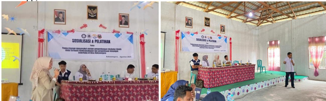
Gambar 2. Materi Literasi Keuangan dan Penguatan Pemasaran Digital

Kegiatan pengabdian kepada masyarakat ini diadakan pada tanggal 27 Agustus 2025 di Aula Kantor Desa Reksonegoro, yang dihadiri oleh perangkat desa, ketua BPD, perwakilan Dinas Koperasi dan UKM Kabupaten Gorontalo serta masyarakat desa yang terdiri dari para ibu rumah tangga dan pelaku usaha, seluruh mitra sasaran mengikuti rangkaian penyuluhan, pelatihan, pendampingan, dan evaluasi. Dalam rangkaian penyuluhan, narasumber menyampaikan materi yang berkaitan dengan literasi keuangan sederhana sekaligus pengelolaan keuangan yang benar dan tepat kepada mitra sasaran agar dalam pengaplikasiannya sesuai dengan tujuan pengabdian. Selain itu pula dalam pelaksanaan penyuluhan ini tim pengabdian juga memberikan penguatan mengenai pemasaran digital melalui media massa (seperti TikTok, Instagram, Facebook, Serta WhatsApp).