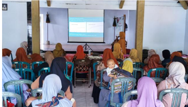
Gambar 2. Pengisian Kuesioner Pre-test dan Post-test

Pelaksanaan kegiatan pengabdian memiliki beberapa keterbatasan selama prosesnya. Keterbatasan waktu pelaksanaan yang menyebabkan penyampaian materi kurang mendalam dan komprehensif. Evaluasi kegiatan yang hanya berfokus pada aspek pengetahuan tanpa mempertimbangkan perubahan sikap dan perilaku ibu balita tidak diukur secara optimal. Keterbatasan tersebut diharapkan menjadi pembelajaran untuk kegiatan pengabdian masyarakat selanjutnya melalui durasi kegiatan yang lebih panjang dan sistem evaluasi yang mampu mengukur secara lebih komprehensif.