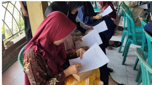
Gambar 3. Sesi Dokumentasi Kegiatan