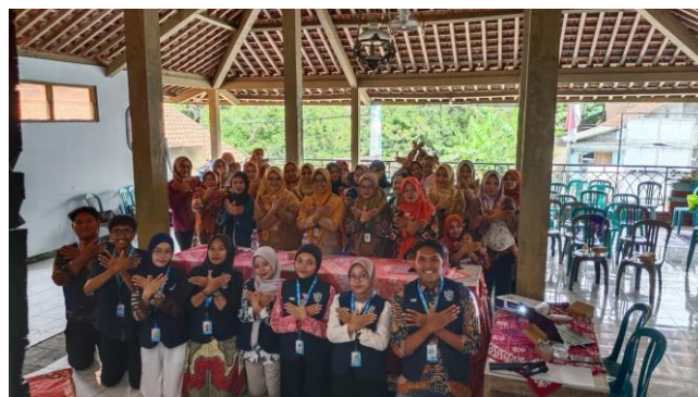
Gambar 4. Sesi Dokumentasi Kegiatan