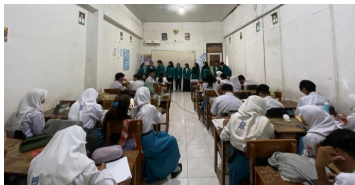
Gambar 4. Pelatihan mengenai digital marketing

Sejalan dengan era digital, pelatihan tidak berhenti pada produksi, tetapi berlanjut pada strategi pemasaran. Siswa diberikan pelatihan mengenai digital marketing untuk mempromosikan produk mochi yang telah dibuat. Hasil pengamatan menunjukkan bahwa siswa mampu mengidentifikasi konten promosi yang kreatif dan sesuai dengan target pasar generasinya. Penumbuhan jiwa kewirausahaan ini terlihat dari keberanian siswa dalam mendiskusikan rencana bisnis sederhana dan cara mengelola keuntungan. Integrasi antara kreativitas bisnis dan literasi digital menjadi modal penting bagi siswa untuk membangun kemandirian ekonomi pasca sekolah.