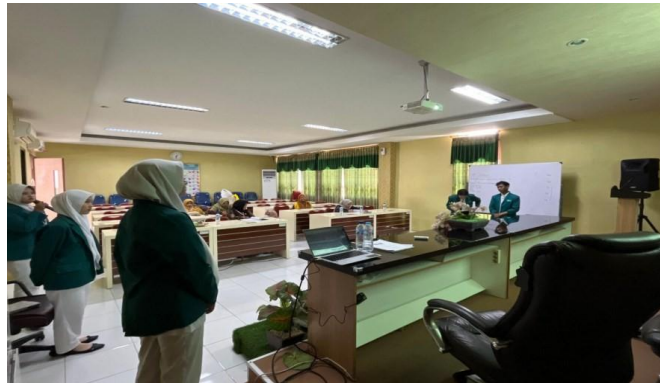
Gambar 5. Pelatihan mengenai digital marketing

dan kewirausahaan sekolah sebagai satu kesatuan ekosistem yang mendukung pertumbuhan mereka secara holistik.