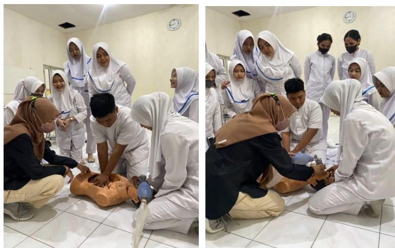
Gambar 2. Pemahaman praktis mengenai pertolongan pertama pada kecelakaan (P3K)

Berdasarkan observasi awal, kapasitas Unit Kesehatan Sekolah (UKS) masih memerlukan optimalisasi, terutama dalam hal prosedur tetap penanganan gawat darurat. Melalui edukasi ketangkasan medis, siswa diberikan pemahaman praktis mengenai pertolongan pertama pada kecelakaan (P3K). Siswa menunjukkan antusiasme tinggi saat simulasi penanganan kondisi darurat medis ringan yang sering terjadi di lingkungan sekolah. Selain itu, edukasi kesehatan reproduksi dan konseling gizi remaja memberikan perspektif baru bagi siswa mengenai pentingnya menjaga kualitas hidup sehat sejak dini. Integrasi materi ini bertujuan agar siswa tidak hanya memiliki kemampuan teknis medis, tetapi juga kesadaran preventif terhadap masalah kesehatan remaja yang kompleks.