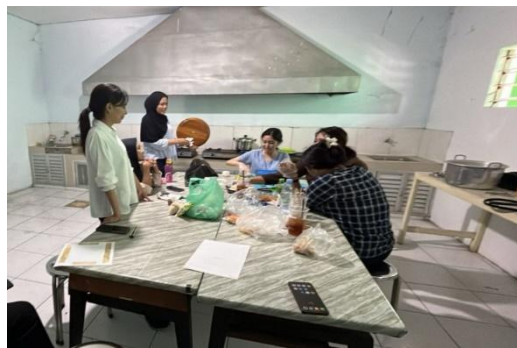
Gambar 3. Pembuatan produk pangan inovatif berupa "Mochi Isian Kacang Merah"

Pemberdayaan ekonomi dilakukan melalui demonstrasi pembuatan produk pangan inovatif berupa "Mochi Isian Kacang Merah". Pemilihan produk ini didasarkan pada dua pertimbangan: nilai gizi kacang merah yang tinggi (sumber protein nabati dan serat) dan popularitas kudapan mochi di kalangan remaja. Siswa terlibat aktif dalam proses produksi, mulai dari pengolahan bahan hingga teknik pengemasan yang menarik. Pembahasan mengenai produk ini ditekankan pada "sinergi" antara nutrisi dan nilai jual. Hal ini membuktikan bahwa produk bisnis yang dikembangkan oleh siswa tidak harus mengesampingkan aspek kesehatan, namun justru dapat menjadi nilai tambah ( unique selling point ) dalam kompetisi pasar.