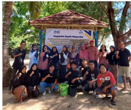
Gambar 4. Tim PKM selesai membuat POC dari Limbah Organik dan gulma di Pantai Toronipa

Partisipasi dan keaktifan masyarakat/peserta dalam suatu pelatihan atau kegiatan dalam mengikuti tahapan program dapat menentukan tingkat keberhasilan program/kegiatan tersebut. Konsep komunikasi tatap muka menjadi alternatif utama dan efektif yang dirasakan masyarakat/petani dan narasumber (Muchtar et al. , 2015). Masyarakat memiliki peran yang penting dan menjadi subjek utama dalam tahapan pelaksanaan kegiatan. Hasil evaluasi menunjukkan bahwa tingkat keberhasilan dalam PkM ini sebesar 85%, dengan mengacu pada keaktifan dan antusiasmenya yang tinggi, terutama dalam kegiatan diskusi dan tanya-jawab. Pada saat kegiatan ini, petani sangat aktif dalam melibatkan diri dalam praktek pembuatan pupuk, sekaligus banyak menanyakan mengenai materi yang merupakan hal yang baru bagi masyarakat di sekitar Pantai Toronipa.