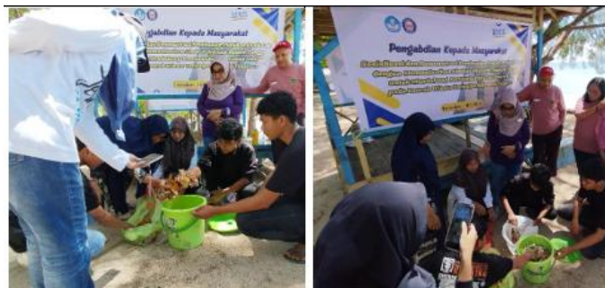
Gambar 3. Pelatihan pembuatan pupuk organik cair berbahan dasar limbah organik dan gulma di wilayah Pantai Toronipa

Pupuk organik cair (POC) mengandung berbagai senyawa esensial yang diperlukan oleh tanaman, baik unsur makro maupun mikro. Bahan organik yang terkandung dalam POC memiliki manfaat yang sangat besar bagi tanah dan tanaman, walaupun dalam bentuk cair.