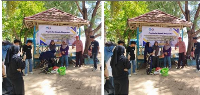
Gambar 2. Pembimbingan dan Pengarahan pembuatan pupuk organik cair berbahan dasar limbah organik dan gulma di wilayah Pantai Toronipa

et al. , 2020). Proses pembuatan POC yang cepat dengan cara yang sederhana (Rakian et al. , 2023) membuat Masyarakat yang ada di kawasan Pantai Toronipa tertarik untuk membuat secara mandiri. Di sisi lain, gulma yang dianggap sebagai tanaman pengganggu, belum dimanfaatkan sama sekali. Hal ini tentunya berbanding terbalik dengan manfaat yang dapat diperoleh dari gulma tersebut (Karimuna et al. , 2016).